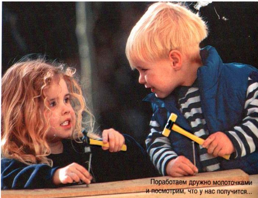
Поработаем дружно молоточками и посмотрим, что у нас получится...

Данное качество может остаться у левши надолго. Самый яркий пример – ребёнку дают задание срисовать незнакомую фигурку с большим количеством деталей. Пытаясь перенести изображение на бумагу, маленький художник долго крутит и образец, и бумагу... В результате ребёнок понимает, что у него получилось